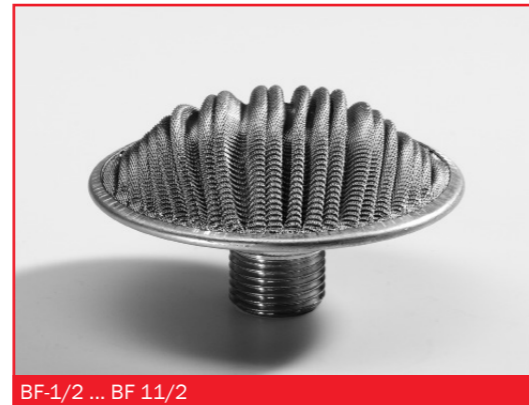
BF-1/2 ... BF 11/2