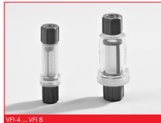
VFI-4 ... VFI 8